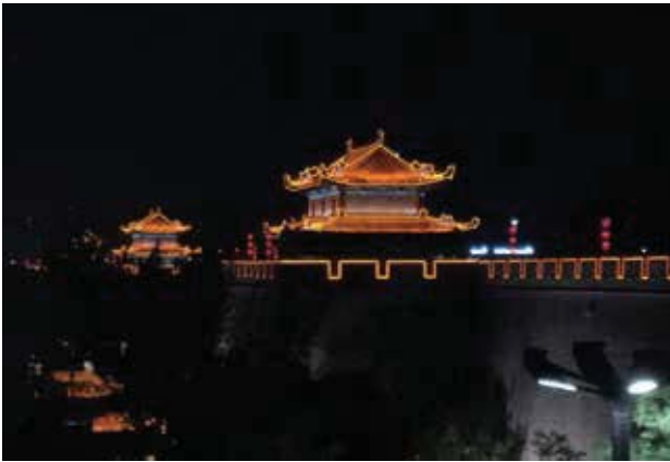
古城西安華燈璀璨，盛世繁華像是現代「長安」