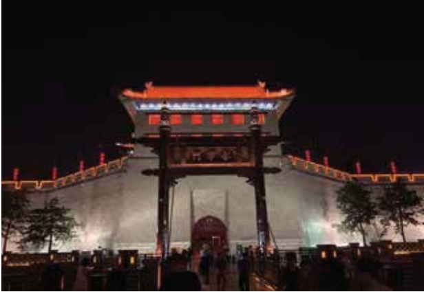
西安古城永寧門的絢麗夜景