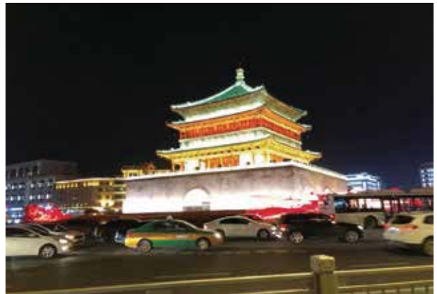
鐘樓夜景璀璨奪目，散發出奪人心魄的光彩