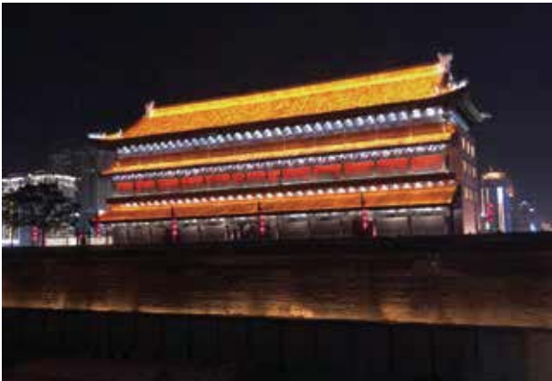
箭樓的夜景非常壯觀，在彩色的燈光下，整個輪廓都清晰可見照耀