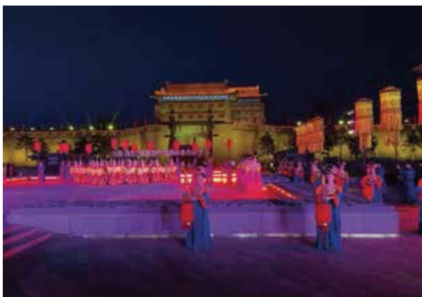
一個穿越時空夢回盛唐的國賓禮遇