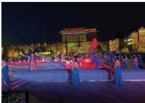
華麗是唐樂舞的一大特色，燈光、樂曲、舞步、布景、服裝、妝容等全都十分絢麗