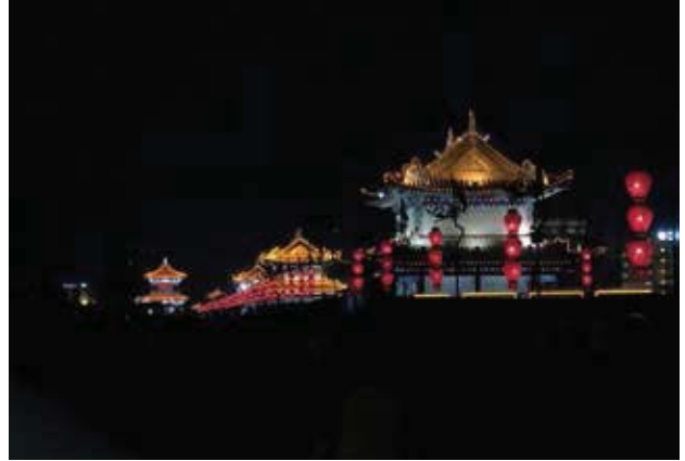
夜幕下的古城被萬盞彩燈裝點的金碧輝煌