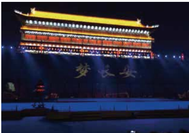
《夢長安—大唐迎賓盛禮》是世界唯一以盛唐禮儀文化為主題的旅遊文化演出