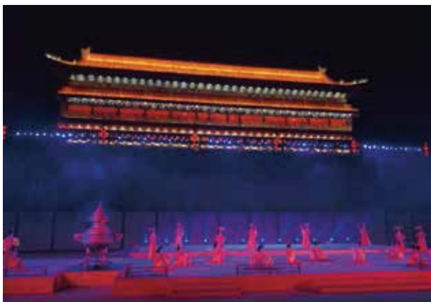
一台融合千年古都的歷史與絲路風情的文化盛禮