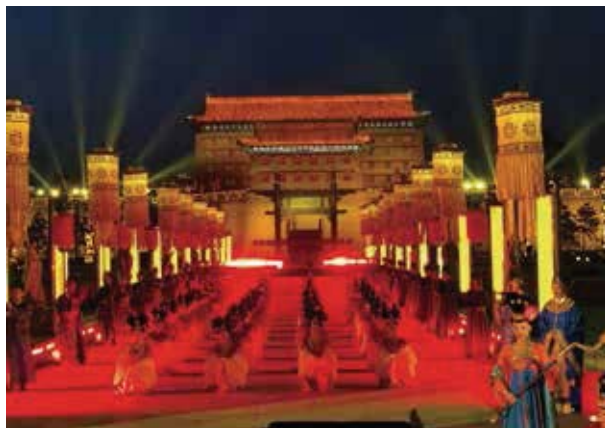
《夢長安》在享有「文化國門」盛譽的西安城牆永寧門拉開序幕