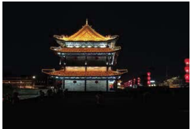
西安古城的夜景，宛若人間仙境，美不勝收